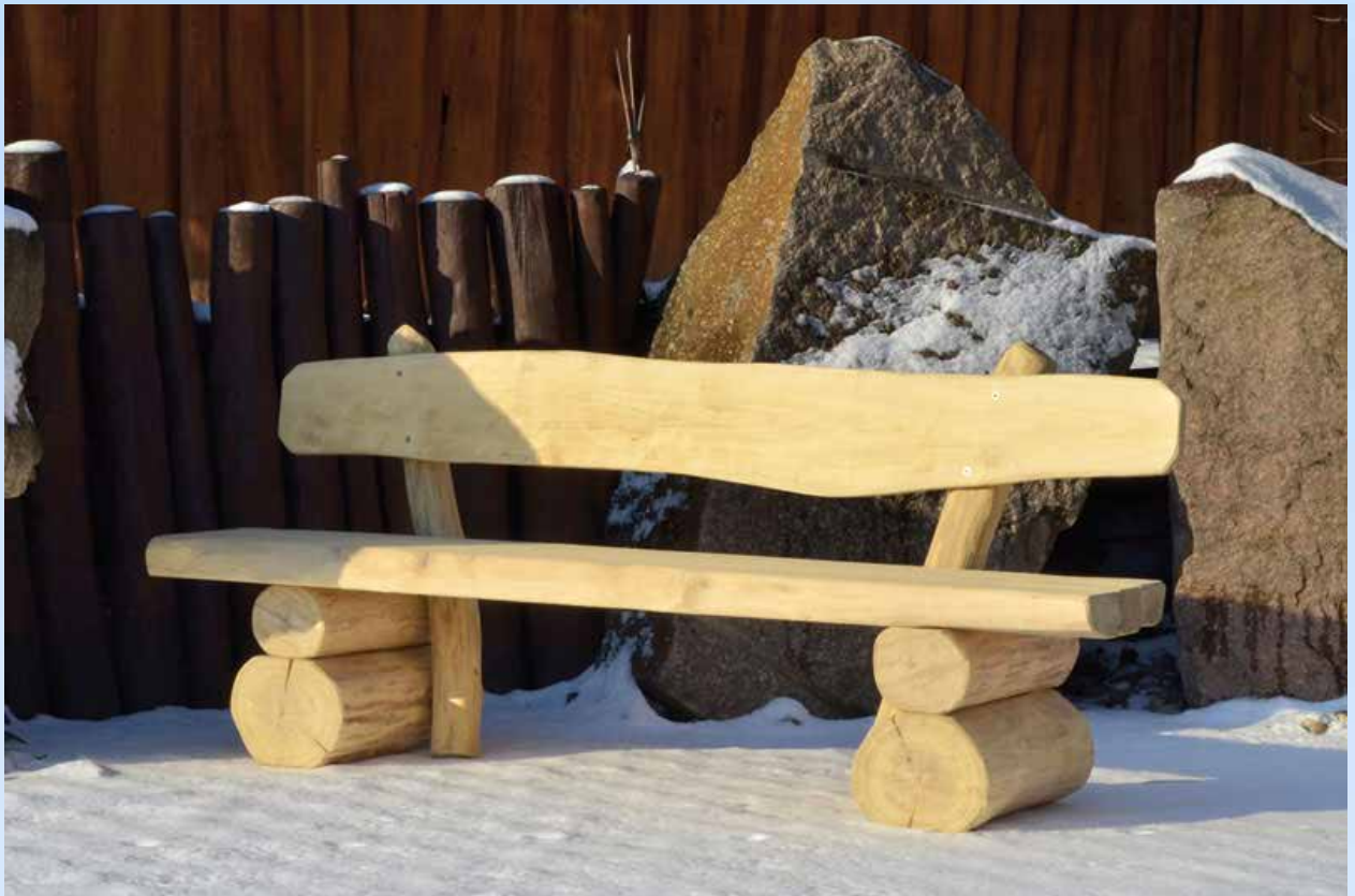
Bildbeispiel - Robustes Untergestell aus ca. je 2-3 massiven Stammstücken